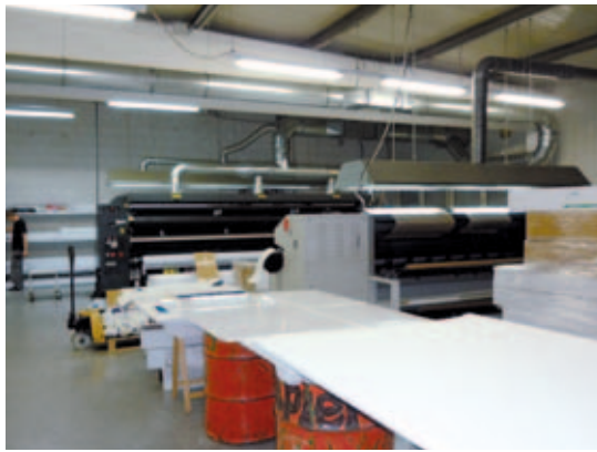
Neben der Sublitex verfügt das Unternehmen über einen HP XL Jet (links) und eine Vutek QS 2000 (rechts), außerdem gibt es noch einen HP Z6100, zwei Mimaki JV33 sowie einen Dgen Teleios.