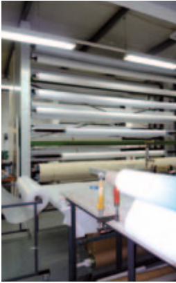
Die mit der Sublitex bedruckten Textilien entsprechen dem Ökotex-100-Standard.